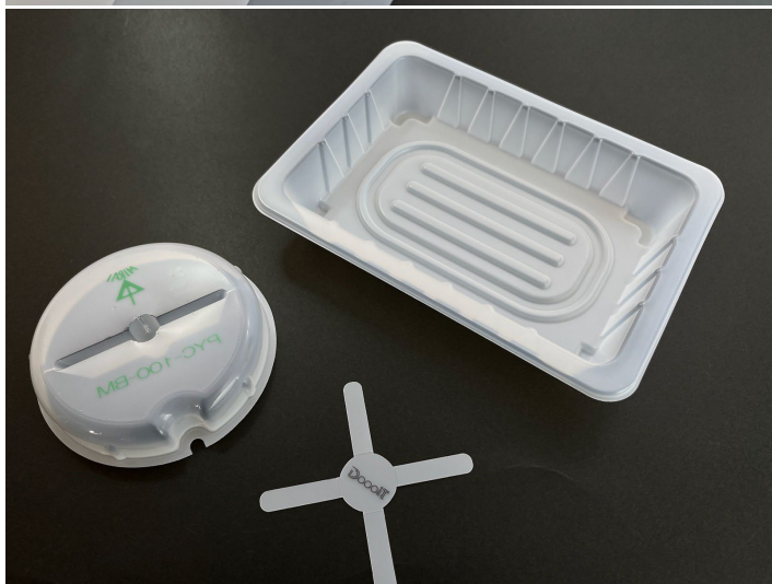
成型用ユーミシート 印刷・成型加工品